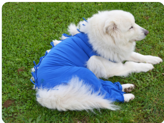
Anche per grandi taglie

Bendana è un bendaggio elastico studiato per coprire completamente le medicazioni nel post operatorio. Protegge la zona operata ma lascia all'animale assoluta libertà di movimento garantendo l'igiene in casa e la pulizia della cuccia. Bendana è una protezione fornita di lacciche permette di modularne tensione e lunghezza, conformandola a qualsiasi taglia e dimensione. È semplice da usare e facile da rimuovere anche durante i controlli. Realizzata in tessuto naturale di Jersey ( \geq 90\% cotone - 5÷10% Elastan) è morbida e traspirante. Bendana nasce come prodotto monouso, ma è eventualmente lavabile e sterilizzabile. Protegge i segni dell'intervento ed è un significativo simbolo di convalescenza.