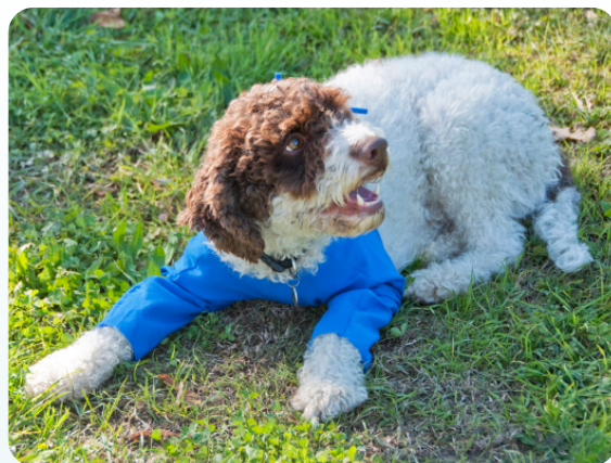
Pratica e confortevole