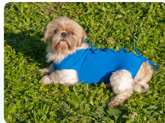
Morbida ed elastica